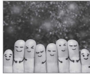
شکل ۳. فرد سالم از نظر اجتماعی، نقش‌های اجتماعی خود را توأم با احساس آرامش و رضایتمندی انجام می‌دهد.

سلامت اجتماعی، وضعیت رفتارهای اجتماعی مورد انتظار از فرد را شامل می‌شود که اثرات شناخته شده و مثبتی بر سلامت جسم و روان فرد دارد و موجب ارتقای سازگاری اجتماعی و تعامل فرد با محیط پیرامون می‌شود. افراد سالم از نظر اجتماعی از طیف وسیعی از ارتباطات با خانواده، دوستان و آشنایان برخوردارند و قادر به تعامل سالم با دوستان صمیمی خود هستند. این افراد می‌توانند به حرف دیگران گوش بدهند، دریافت‌های قلبی خود را ابراز کنند، پیوندها و دوستی‌های سالمی تشکیل دهند، به روشی قابل قبول و مسئولانه عمل کنند و در جامعه جایگاه خوبی برای خود پیدا کنند (شکل ۳).