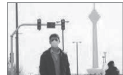
شکل ۵. عوامل مؤثر بر سلامت

در جدول زیر نمونه‌هایی از هریک از چهار عامل مؤثر بر سلامت مشخص شده است.