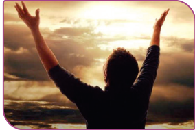
آگاه باشید تنها یاد خدا آرامبخش دل‌هاست (سورهٔ رعد، آیهٔ ۲۸)

از دلایل ابتلای افراد به بیماری روحی - روانی که به دنبال خود مشکلات جسمانی و اجتماعی را نیز به بار می‌آورد، داشتن احساس پوچی و بی‌هدفی در زندگی است. (که خود ناشی از نداشتن سلامت معنوی است.)