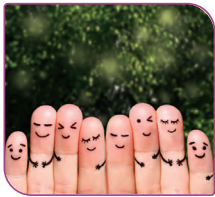
فرد سالم از نظر اجتماعی، نقش‌های اجتماعی خود را توأم با احساس آرامش و رضایت‌مندی انجام می‌دهد.