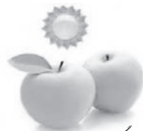
سلامتی بزرگ ترین سرمایه انسان است.

حضرت علی علیه السلام در حکمت ۳۸۸ نهج البلاغه می فرماید: «بدانید یکی از بلاها، تهی دستی است و سخت تر از آن، بیماری تن است، و سخت تر از آن، بیماری دل است. بدانید یکی از نعمت ها، ثروت و بهتر از آن سلامت بدن است و بهتر از آن تقوای دل است.» بنابراین در فرهنگ متعالی اسلام سلامت به عنوان یک ارزش مطرح شده و با تعبیرات لطیفی همچون، برترین نعمت ها، حسنه دنیا، نعمتی که انسان از شکر آن عاجز است و ددها عنوان دیگر، توصیف و اهمیت آن گوشزد شده است.