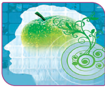
نماد سلامت روان