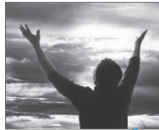
شکل ۴. آگاه باشید تنها یاد خدا آرامش بخشد دل‌هاست (سوره رعد، آیه ۲۸)

یکی از دلایل ابتلای افراد به بیماری‌های روحی-روانی که به دنبال خود مشکلات جسمانی و اجتماعی را نیز به بار می‌آورد، داشتن احساس پوچی و بی‌هدفی در زندگی است که خود ناشی از نداشتن سلامت معنوی است. افراد سالم از نظر معنوی اهدافی اساسی در زندگی دارند، فراتر از جهان مادی به جهان معنوی نیز می‌نگرند، آرامش دارند و به دیگران این آرامش را نیز منتقل می‌کنند. سطح بالایی از ایمان به خدا، امیدواری ، تعهد ، کمال‌جویی ، پایبندی به اخلاقیات و هدف داشتن در زندگی و اعتقاد به معنویت و معاد از نشانه‌های سلامت معنوی است (شکل ۴).