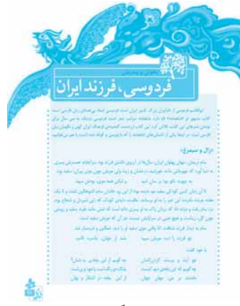
«صفحه‌ی ۹۱ کتاب درسی»