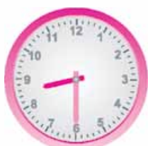
۲- هشت و نیم