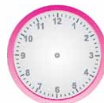
الْخَامِسَةُ وَ الرُّبْعُ