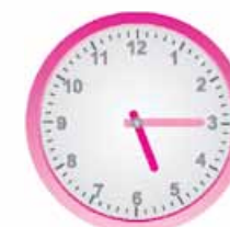
۱- پنج و ربع