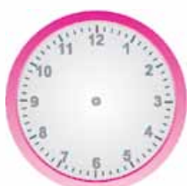
الثَّامِنَةُ وَ النِّصْفُ