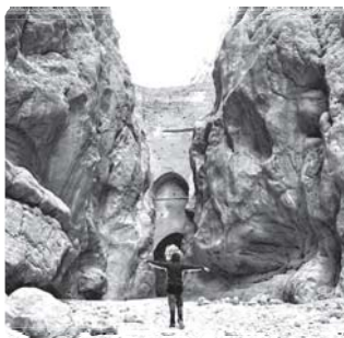
سد شاه عباسی (طبرس، خراسان جنوبی) قدیمی‌ترین و بزرگ‌ترین سد قوسی جهان است که یکی از نمونه‌های عالی خلاقیت، دوران‌اندیشی و سخت‌کوشی ایرانیان است.

محیط جغرافیایی از تعامل بین محیط طبیعی و محیط انسانی به وجود می‌آید.