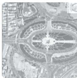
میدان آزادی - ۱۳۹۵