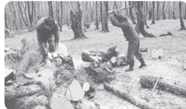
قطع بی‌رویه درختان جنگل - مازندران

نکته عملکردی که با درک توان‌های محیط طبیعی صورت می‌گیرد، تعادل محیط را برای مدت طولانی حفظ می‌کند.