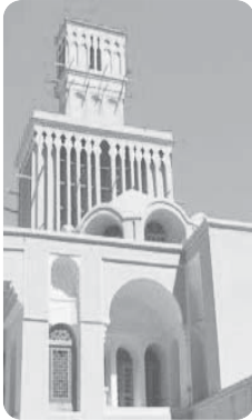
بادگیر دو طبقه ابرکوه - استان یزد

محیط طبیعی مجموعه‌ای متعادل است، اما دخالت انسان ، زمینه‌های تغییر محیط را فراهم می‌کند؛ زیرا هوش و استعداد انسان به او کمک می‌کند تا محیط پیرامون را در جهت رفع نیازهای خود و رسیدن به یک زندگی بهتر تغییر دهد و به گونه‌ای که می‌خواهد از محیط بهره ببرد. در دهه‌های اخیر، فناوری سبب شده تا انسان، بر میزان تأثیرگذاری خود در محیط بیفزاید. فناوری‌های جدید موجب شده انسان بتواند از اعماق زمین بهره‌برداری کند و میزان دسترسی خود به محیط طبیعی را افزایش دهد.