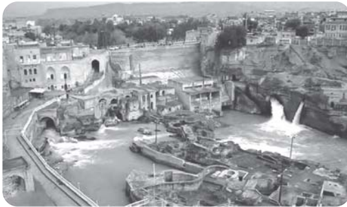
سازه‌های آبی شوشتر (استان خوزستان) از بزرگ‌ترین مجموعه‌های صنعتی شناخته‌شده در عصر پیش از انقلاب صنعتی در جهان است و از سوی سازمان یونسکو (شاهکار نبوغ و خلاقیت) نامیده شده است.

انسان در طول تاریخ همواره تلاش کرده است که ناشناخته‌ها و مجهولات جهان هستی را معلوم کند و با استفاده از علوم و دانش‌های مختلف، وضع زندگی خود را بهبود ببخشد. یکی از قدیمی‌ترین دانش‌هایی که بشر برای بهبود شرایط زندگی خود از آن استفاده کرده، دانش جغرافیا است.