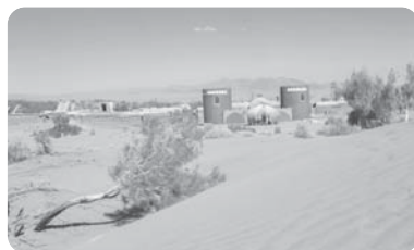
کویر مصر - اصفهان

در مکان‌های مختلف، روابط متقابل انسان و محیط شکل‌های گوناگونی به خود می‌گیرد و بدیهی است که عملکرد مثبت و منفی انسان در یک محیط جغرافیایی جنگلی با یک محیط جغرافیایی بیابانی تفاوت‌های چشمگیری دارد.