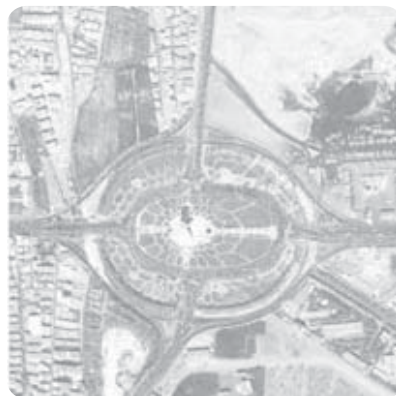
میدان آزادی - تهران ۱۳۶۵