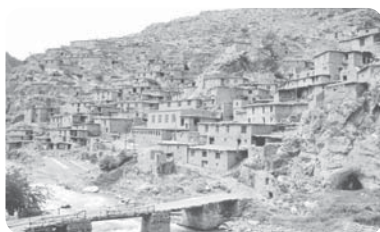
روستای پالنگان - کامیاران - کردستان

③ با مطالعه میزان منابع آب شهر، امکان توسعه شهر را پیش‌بینی می‌کند. (جغرافیای آب‌ها)