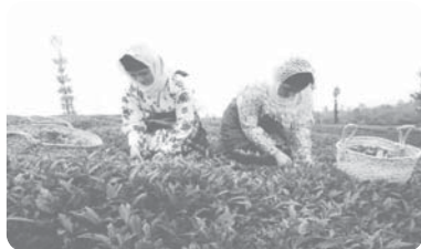
کشاورزی و رفع نیازها - برداشت چای - لاهیجان - گیلان

② نگاه سودجویانه برای رسیدن به خواسته‌ها (برخورد افراطی و حداکثری)