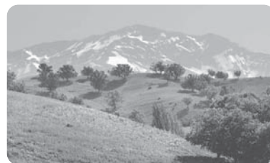
زردکوه - چهارمحال بختیاری