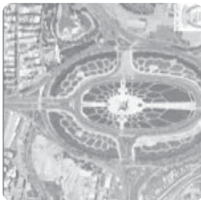
میدان آزادی - تهران ۱۳۹۵

مثال در تصویرهای زیر مشاهده می‌کنید که در اثر تعامل مداوم انسان با محیط و دخالت و دستکاری او در محیط طبیعی، به تدریج از چشم‌اندازهای طبیعی عمارت ایل‌گولی، کاسته و بر چشم‌اندازهای ساخته دست بشر، افزوده شده است.