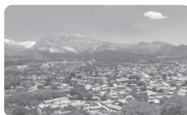
شهر کوهپایه‌ای سی‌سخت - کهگیلویه و بویراحمد