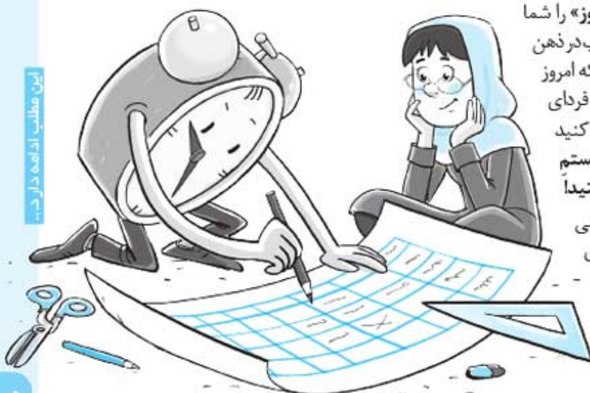
این مطلب ادامه دارد...

۵ تعادل را در برنامه‌ریزی رعایت کنید، یعنی متناسب با زمان، برای دروس مختلف برنامه‌ریزی کنید. می‌توان گفت بهترین شیوه برای رعایت تعادل در برنامه‌ی دروس «برنامه‌ریزی موزاییکی» (جدول خانه‌های خالی) است. برنامه‌ریزی موزاییکی را در مقاله‌ی هفته بعد با هم می‌بینیم.