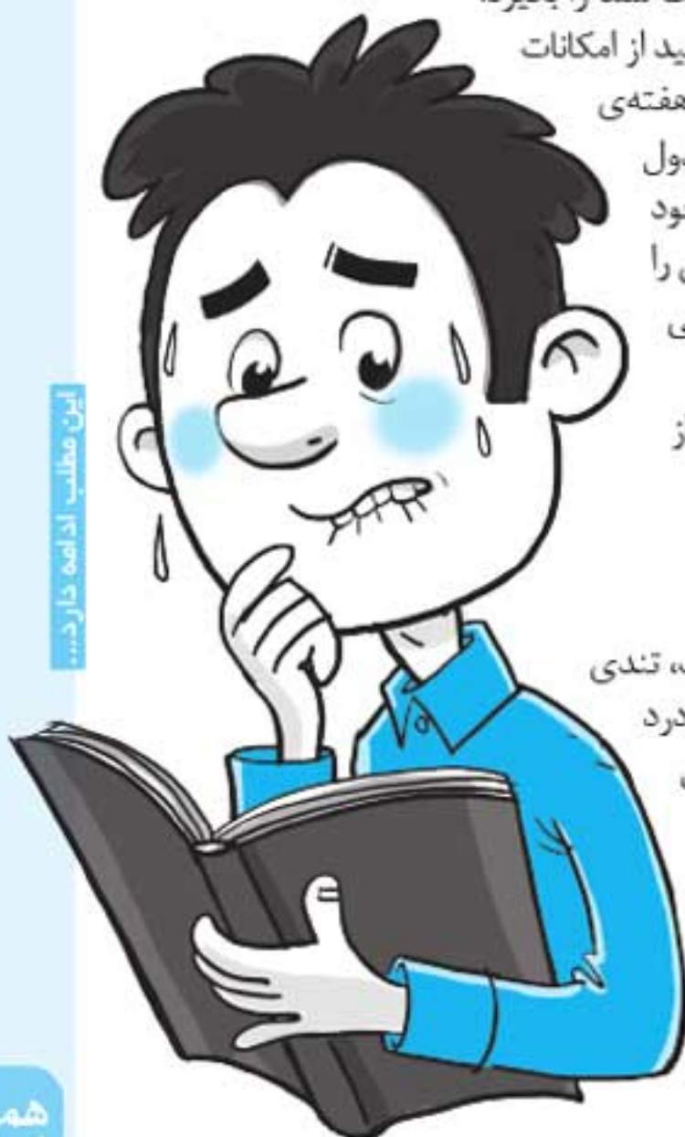
این مطلب ادامه دارد...

تغییرات بدنی که زمان اضطراب رخ می‌دهد: لرزش دست، تعرق، تپش قلب، تندی نفس، دلهره، خشکی دهان، داغی بدن، بی‌قراری، تکرر ادرار، سرگیجه، سردرد و سستی. اگر این روند به صورت مداوم ادامه پیدا کند، تغذیه‌ی فرد مختل می‌شود و ممکن است پر خوری یا بی‌اشتهایی به سراغ او بیاید. حالت تهوع، دل‌پیچه یا معده درد هم از دیگر علائم آن است. البته ممکن است فرد مشکل بی‌خوابی و بد خوابی نیز پیدا کند که تمامی این عوامل، روند عادی زندگی و به دنبال آن روند درس خواندن او را تحت تأثیر قرار می‌دهد. بهتر است در صورت مشاهده این موارد به متخصص روانپزشک یا روان‌شناس حوزه‌ی نوجوان مراجعه کنید.