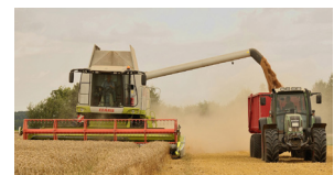
حصاد القمح برداشت گندم