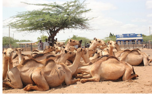
تَرْبِيَةُ الْجِمَالِ پرورش شتران