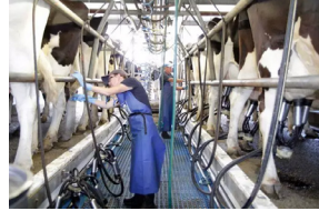
تَرْبِيَةُ الْبَقَرِ پرورش گاو