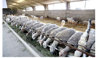
تَرْبِيَةُ الْغَنَمِ پرورش گوسفند