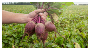
زراعة الشوندر کاشت چغندر