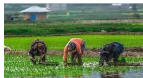
زراعة الرز کاشت برنج