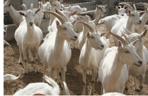
تَرْبِيَةُ الْمَاعِزِ پرورش بز